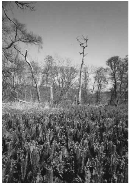
Ön Lübeck i Krageholmsjön.

Ön Lübeck förklarad som naturreservat av Länsstyrelsen.