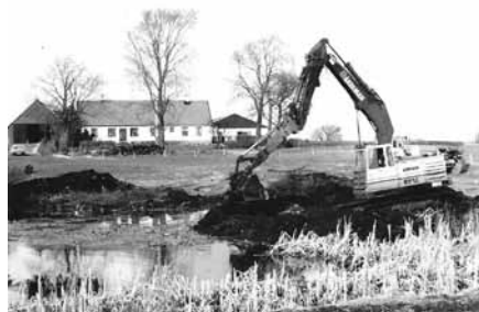
Pågående grävning i Sövestad.