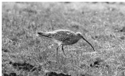
Storspov Öja mosse.

oktober månad. Det innebär att sju vatten grävts till en kostnad av knappt 100.000 kr.