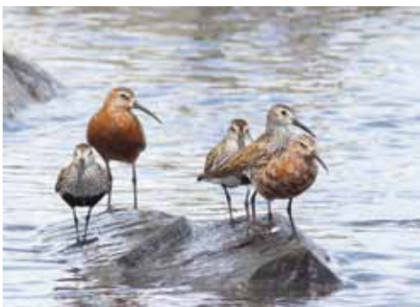
Spovsnäppa och Kärrsnäppa - Kjell Södervall Vinnarbild i vårens Fototävling