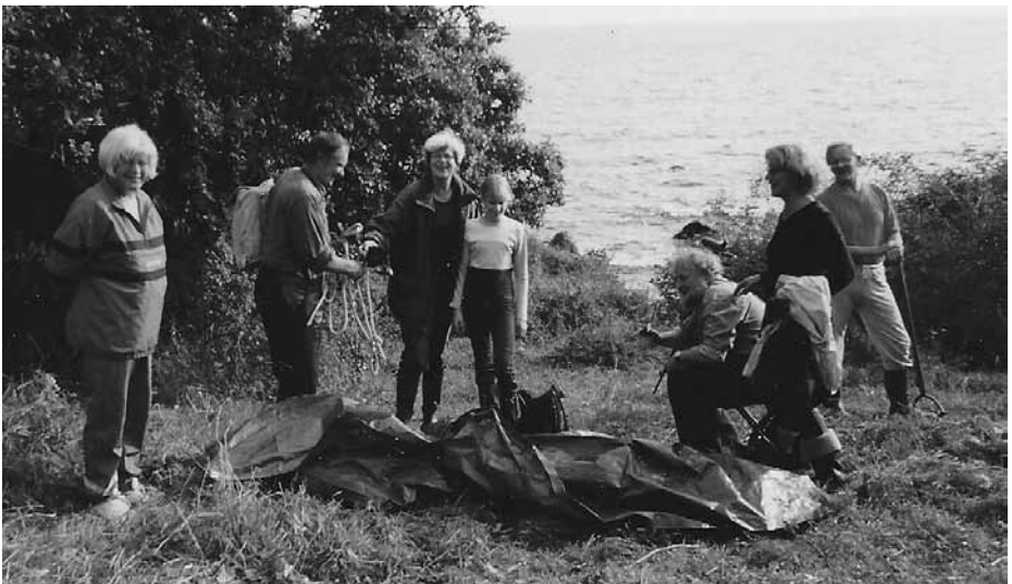
Vila efter sensommar röjning i Skarviken.

Grävning av småvatten vid Marietorps naturskola. Bidrag med 60 000 kr vardera från Region Skåne och Ystads kommun.