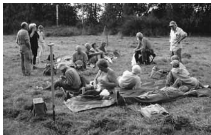
Höbärgning i Hassellunden. Vålförtjänt fika och gott om fästingar.

Kurt Ivarsson rapporterar i YstadNatur om Kornsparven i Skåne 2002. Minst 20 hanar hävdade revir i det aktuella området från Kabusakorset i väster till Hagestad mosse i öster.