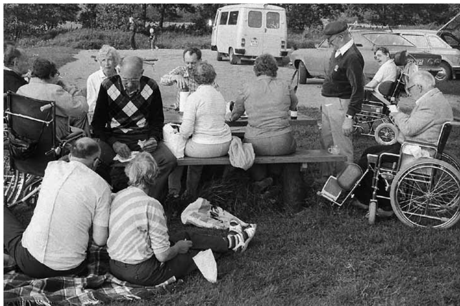
Under några år hade vi samarbete med handikapporganisationer, nu återupptaget igen. Då gjorde vi bl.a. utflykter till Kragholmsområdet, där vi kunde ta med även rullstolar.

Skrivelser till Miljö- och hälsoskydds nämnden i Ystads kommun angående föroreningen av åarna i kommunen.