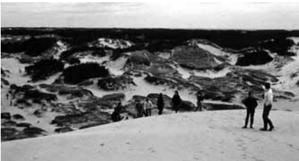
Långresor har organiserats av föreningen några gånger, speciellt de första åren. Spanien, Jugoslavien, Polen och Danmark har besökts och på hemmaplan Västergötland och Öland. Bilden är från klitterlandskapet på västra Jylland 1987.