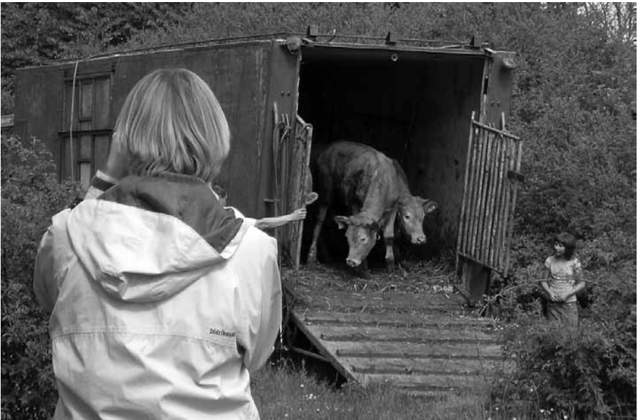
Skarviken har varit ett kärt projekt i över 20 år. Många arbetstimmar men också många exkursioner har gått till denna pärla. Här hade vi inbjudit till "kosläpp".