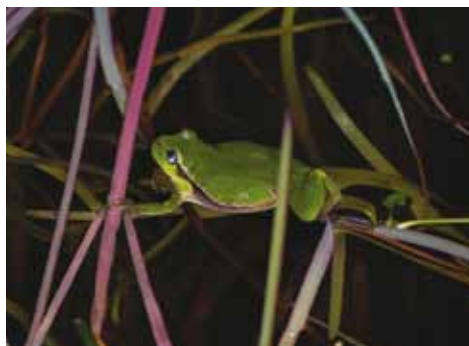
Lövgroda - Magnus Isaksson